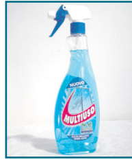
DD/65 - ZIP MILLEUSI