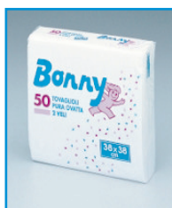
A/13 - TOVAGLIOLI OVATTA 2 VELI F.TO 38X38 BIANCHI