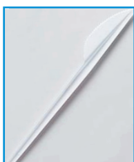
F/21 - COLTELLI PLASTICA