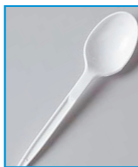
F/22 - CUCCHIAI PLASTICA