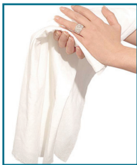
PX/26 - PANNO POLVERE ANTISTATICO FORMATO 30x60