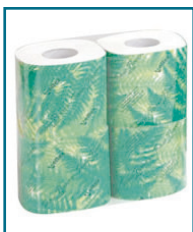
D/112 - ROTOLI CARTA IGIENICA FASCETTATA