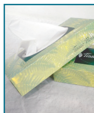
D/7 - VELINE 100 FOGLI