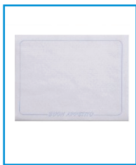
B/00 - TOVAGLIETTA F.TO 30X40 BIANCA

IMBUSTATE DA 200PZ. CONFEZIONE DA 2500PZ.