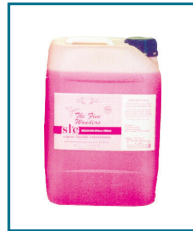
DD/69TRIS - SAPONE LIQUIDO LIEVE MANI TANICA