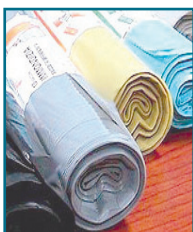
G/20 - SACCHI IMMONDIZIA NERI/BIANCHI DIVERSI FORMATI