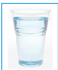
F/12 - BICCHIERI KRISTALL 300CC. -