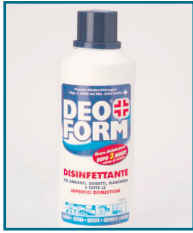
DD/03 - DETERGENTE DEOFORM