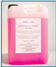
DD/69 - DETERGENTE LIQUIDO MON AMI