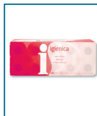
D/02 - CARTA IGIENICA 2/V IN ROTOLINI