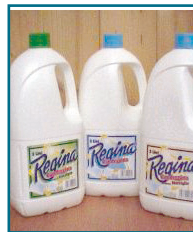
DD/73 - CANDEGGINA NON PROFUMATA