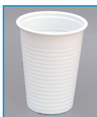
F/3 - BICCHIERI BIANCHI 200CC.