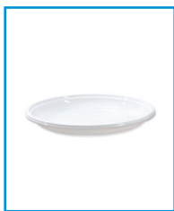
F/32 - PIATTI PIANI 16 GR.