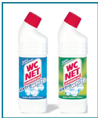
DD/122 - WC NET