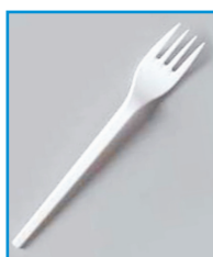
F/20 - FORCHETTE PLASTICA