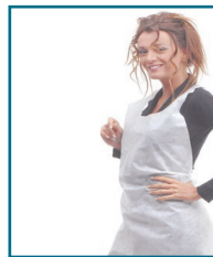
D/107 - GREMBIULE PLATICA FORMATO 70x125