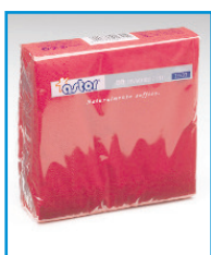
A/7 - TOVAGLIOLI OVATTA 2 VELI F.TO 40X40, VARI COLORI -