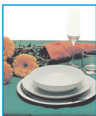
F/48 - TOVAGLIA CARTA SECCO F.TO 100x100 CON DIVERSE COLORAZIONI